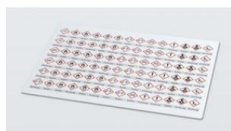
Planche d'étiquettes avec mentions d'avertissement selon le SGH